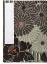
レトロフラワー(ブラック)