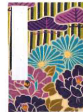
レトロフラワー(パープル)

レトロフラワー柄の大きな生地を裁断しているので、生地を取り位置で印象が異なります。厚めの紙を使用し、裏移りにくいのもうれしい