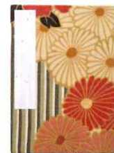
レトロフラワー(ピンクベージュ)

レトロフラワー柄の大きな生地を裁断しているので、生地を取り位置で印象が異なります。厚めの紙を使用し、裏移りにくいのもうれしい