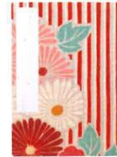
レトロフラワー(レッド)

本店(ネット販売) http://www.noren-net.jp ブランドサイト http://www.noren-japan.jp